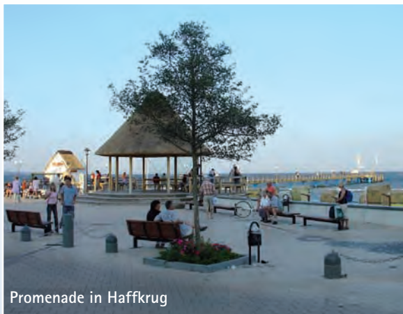
Promenade in Haffkrug